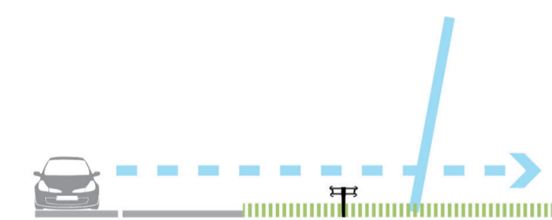
Hellend scherm transparant