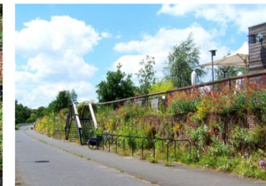
Bloemenmuur Griftpark Utrecht