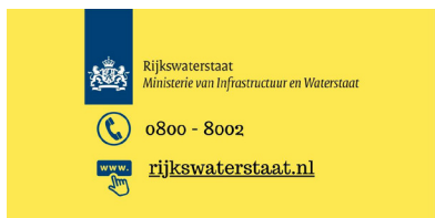
Rijkswaterstaat ➤ Projectteam A58