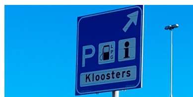
A58 en duurzame innovaties ➤ De eerste mijlpaal is nog maar het begin!