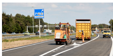
Bouwen aan ➤ Eindhoven-Tilburg

Hoe gaan Rijkswaterstaat en projectteam InnovA58 hiermee om? Je leest het in deze nieuwsbrief. In de tussentijd kunnen we gelukkig wél vol energie door met zichtbare, duurzame innovaties aan de A58 bij parkeerplaats Kloosters bij Oirschot. In deze nieuwsbrief vertellen we waarom dat ook belangrijk is. En er is feestelijk nieuws over de Innovatiestrook 'op Kloosters'.