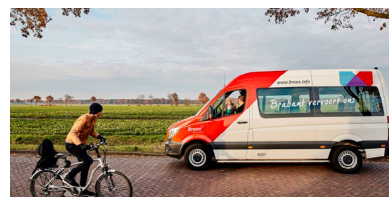
SmartwayZ.NL ➤ Reizen en de toekomst