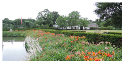
Wegwijs ➤ Ontdekken!