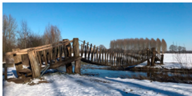
Bouwen aan ➤ Eindhoven-Tilburg

Tracébesluit ter inzage kan komen. Ook bij verzorgingsplaats Kloosters ziet u veel gebeuren: de aanleg van de Innovatiestrook zal halverwege de zomer klaar zijn. In deze nieuwsbrief informeren we u over alle belangrijke en interessante gebeurtenissen bij InnovA58.