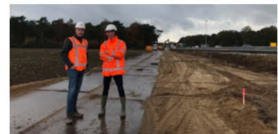
A58 en duurzame innovaties ➤ Dubbelinterview