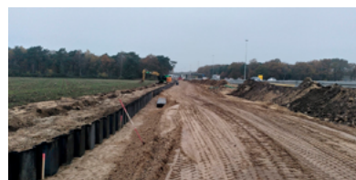
Achtergrond ➤ Wat doen we met gekapte bomen?