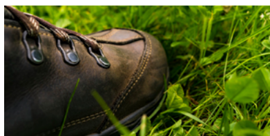
Wegwijs ➤ Ontdekken!